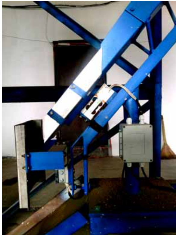
图 2 滑槽秤实物

物料通过引导滑槽进入重力滑槽，从重力滑槽流出后冲到冲力滑槽，然后自然落下去。重力滑