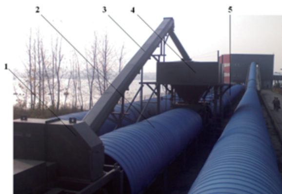
图3 西坝煤码头在线自校准装置

这样一套装置能够在正常输送物料的工作状况下实时检测皮带秤计量称重数据，实现在线自校准的功能，图3是在江苏南京西坝煤码头使用的这样一套装置。